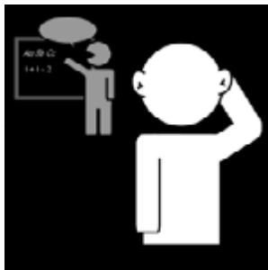
Doen wat de mentor zegt

We hanteren op school vier schoolregels waarmee we de basisveiligheid waarborgen.