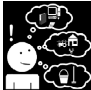
Alle spullen blijven heel