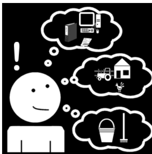
Alle spullen blijven heel